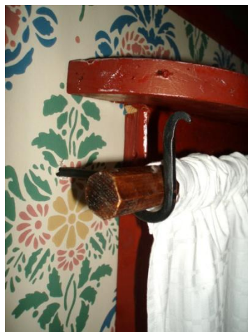
Idébild på krok o stav.

Den åttkantiga staven tillverkar Östra Stenby snickeri .