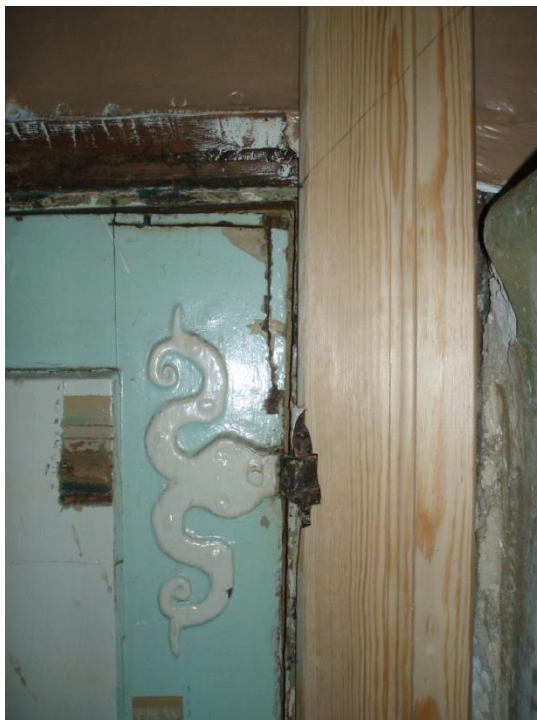
Spismuren lagas mot hemliga rummet