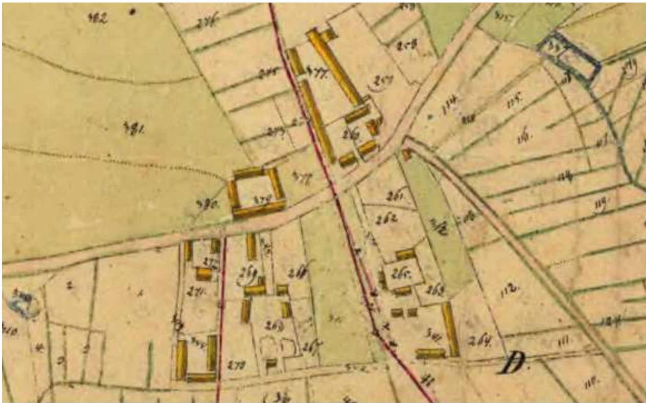
Fristad laga skifte 1843. Gamla gästgivartomten Nr. 311 mellan Nr. 266 och 265