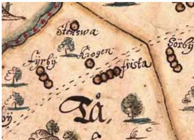
Ägomätning 1650 och Krigsarkivets karta 1653