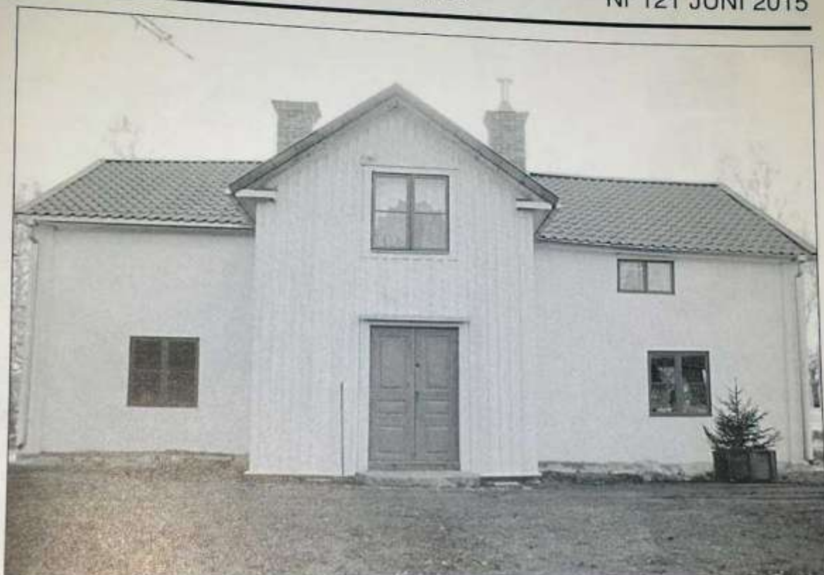
Det gamla gästgiveriet i Fristad i Tåby socken på Vikbolandet håller på att återfå lite av sin forna glans under beskydd av hembygdsföreningen.