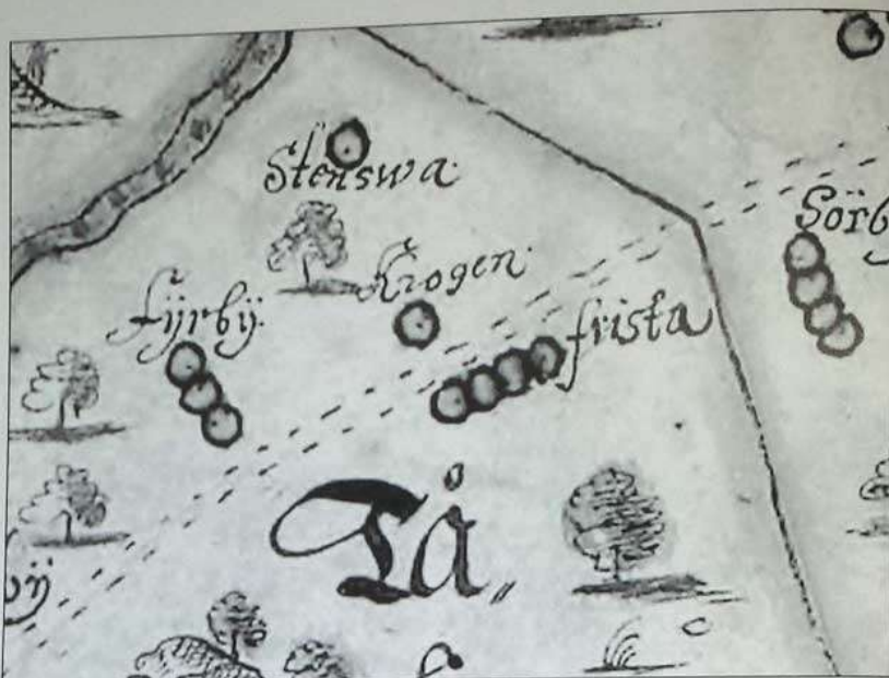
Karta över Fristad från krigsarkivets kartsamlingar anno 1653 med gårdarna på rad på ena sidan av vägen och krogen/gästgiveriet på den andra. Fristad skattegårdar är de två prickarna i mitten.