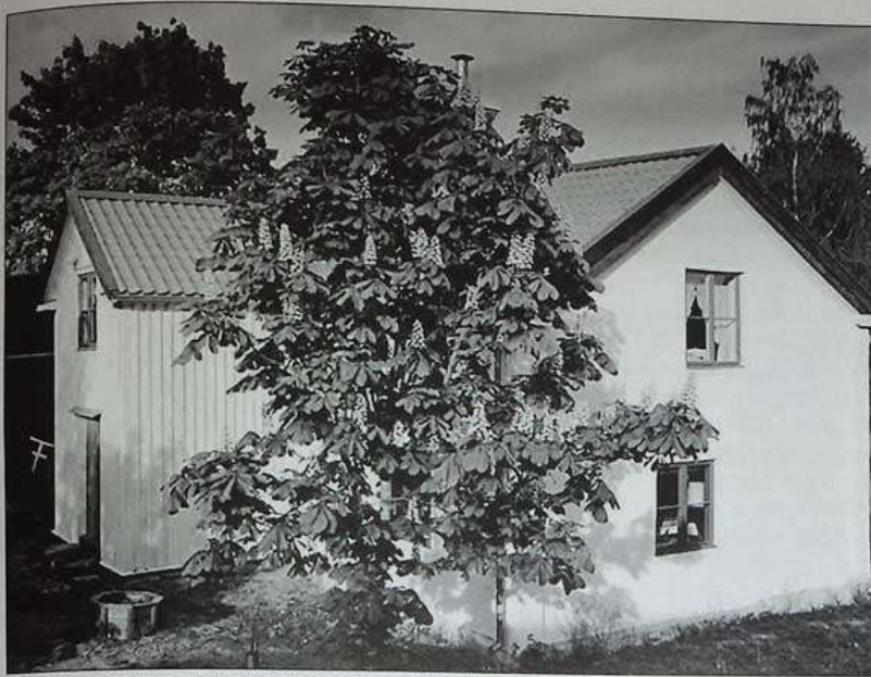
Så här ser samma hus ut i dag efter utvändig renovering.