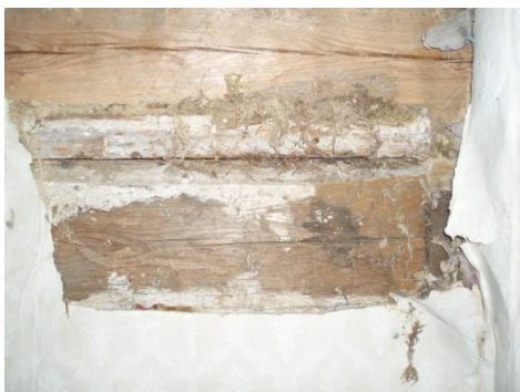
Lercleanat mellan stockarna . Även

väggmossa har använts som tätning. Kan stänktapeten dateras? Den är på lumppapp. Även lagningar förekommer. Stänktapeten är klistrad på stockarna. Mittbandslisten sitter på ca 80cm. Höjden stämmer inte med fönsterhöjden. Fönstren har troligtvis bytts efter stänktapetens tillkomst.